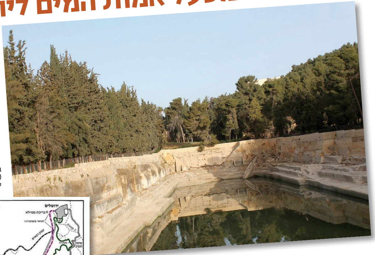
בריכות שלמה