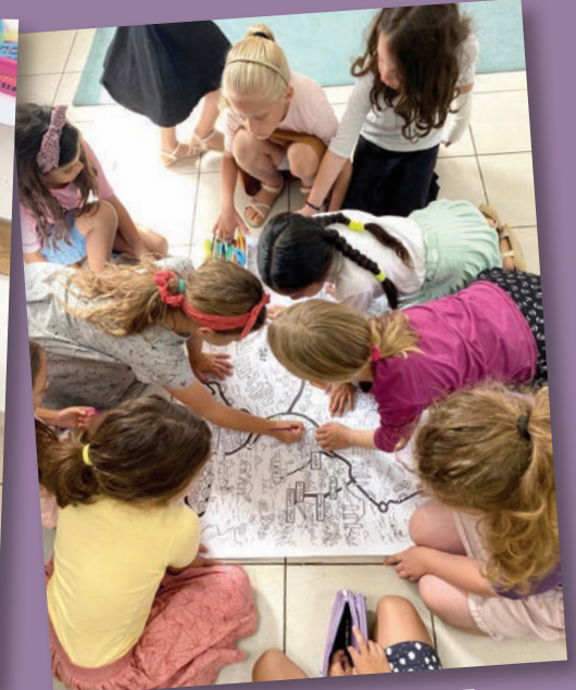
דף צביעה קבוצתי- מפת הגוש