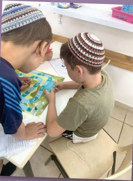
משחק מסלול- אמות המים לירושלים