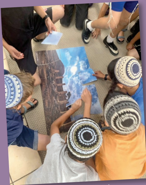
פאזל חידון עם תמונת ההרודיון