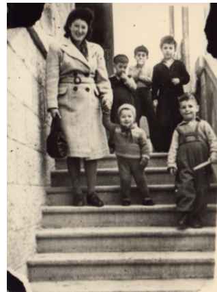
איור 4 ו־5: המפונים במנזר רטיסבון.

על פי חגבי, החיים בצפיפות הרבה והחרדה הקשה גרמו לעצבנות בקרב החברות. השמועות על קשייהן של החברות הגיעו אל החברים שבגוש עציון, ובאחת מאספות החברים צוין כי