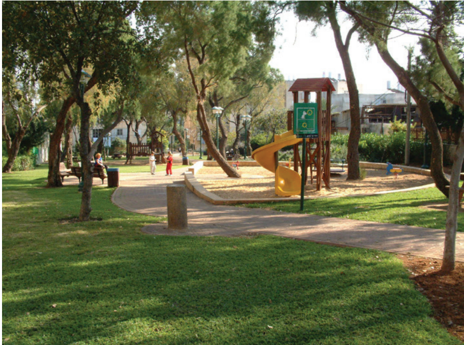
איור 10: מתחם גן עציון השוכן כיום בגבעת עלייה.

עוד בזמן שחלק מהלוחמים היו בשבי בעבר הירדני, החלו הדיונים על עתיד קבוצת כפר עציון. האלמנות הודיעו לשבויים במכתבים שברצונן להמשיך את חיי השיתוף הקיבוציים, והשבויים הודיעו שבגלל ריחוקם מהארץ הם אינם יכולים להשתתף בתהליך קבלת ההחלטות על עתיד הקבוצה. אך לא כל האלמנות היו בדעה זו: עוד בטרם חזרו השבויים החלו נשים לעזוב את הקבוצה. חברה ראשונה עזבה עם בתה עוד בזמן שהות הקבוצה בבית הספר בפתח תקווה. במשק הוחלט לגלות התחשבות, ואף הוקצה סכום של כ-250 ל”י לכל אלמנה שתעזוב (שם: 56–58).