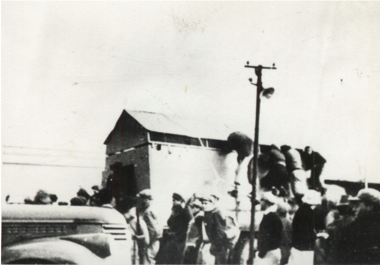
איור 3: הפינוי מכפר עציון.

אשתו, בניו והוריו, כי המלחמה שלנו היא על עצם הקיום... לא פינוי, לא להכין פינוי" (כהן-לוינובסקי 2014 : 33; טל 2006 : 241–258). לעומת זאת, כמעט בכל היישובים שסביב לירושלים ובכלל זה אף ביישובי גוש עציון, התבצע פינוי של תושבים, לרוב נשים וילדים, כבר בשלב הראשוני של המלחמה. בסוף דצמבר 1947 התבצע פינוי של תושבים מהרטוב, בראשית ינואר 1948 מכפר עציון וממשואות יצחק, בסוף פברואר של אותה השנה מכפר אוריה ובאמצע מרץ מעטרות ומנווה יעקב. רק תושבי בית הערבה סירבו לבקשת ההגנה באמצע אפריל לפנות נשים וילדים מהקיבוץ (כהן-לוינובסקי 2014 : 242–245; בן בסט 2008 : 220–223).