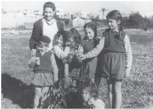
איור 7, 8 ו-9: ילדי כפר עציון בגבעת עלייה.