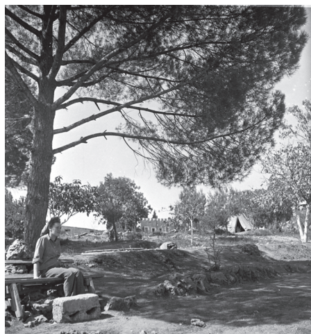
איור 1 ו-2: החיים בכפר עציון ערב המלחמה.