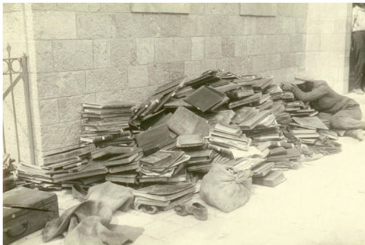
איור 6: ערימות ספרים בחברון לאחר הטבח

כיצד לעשות זאת. בשעה 08:00 התקיימה התייעצות נוספת בהשתתפות סלונים, שניאורסון והרב מלמד. שניאורסון התנדב לנסוע לירושלים בתחפושת ערבית וביקש שסלונים ייתן לו נהג ערבי נאמן. סלונים השיב שהוא אינו יכול לקבל על עצמו אחריות לכך והציע לשניאורסון לחפש בעצמו נהג נאמן (עדות הרב יוסף אלחנן מלמד, אבסל"א, V722/01/10, 27.8.1929; עדות ד"ר כיתאין, 14.9.1929, שם; אירורים 5 ו6).