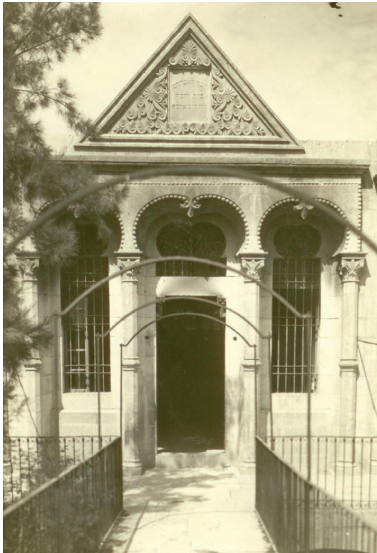
איור 3: בית החולים 'בית הדסה' בחברון

בעדותו בעת חקירתו אצל השופט החוקר בילי ובמהלך המשפט הכחיש טאלב את כל המיוחס לו על ידי קפראטה ויהודי חברון וטען שסייע למשטרה לפזר את הצעירים שהתקהלו וזרקו אבנים. הוא סיפר על פגישה ידידותית עם אליעזר דן סלונים ועם יהודה ליב שניאורסון בשבת בבוקר, אשר שיבחו את פעילותו. כמה עדים ערבים העידו ואישרו את גרסתו (עדות טאלב מרקה במשפטו ועדויות עדי ההגנה, -24 17.10.1929 ספר המשפטים, עמ' 62-74). הוא זכה ליחס מיוחד כאשר הובא לחקירות, והחוקרים לא כבלו את ידיו (מדוע אין שייך טאלב כבול?, הארץ, עמ' 4, 7.10.1929; איור 3).