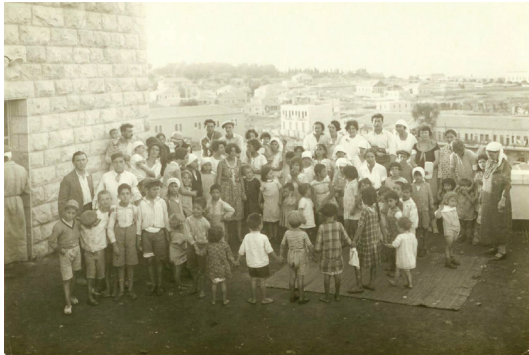
איור 5: ילדי פליטי חברון בבית הבריאות בירושלים, אוסף גרא, באדיבות ארכיון חברון

שניאורסון חזר למלון 'אשל אברהם' ממורמר וכועס ואמר לשוהים שם שאין להם כל תקווה. הוא סיפר שברחוב זרקו אבנים על הרב פראנקו וקפראטה קיבל אותם בגסות בלתי רגילה. הוא הוסיף שבדרך פגש נכבדים ערבים שהיו ידידי שאמרו לחברי המשלחת דברים