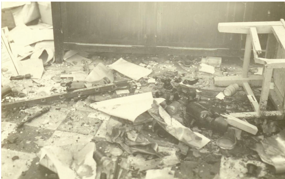
איור 7: הרס במרפאת בית הדסה

עליך לפעול." מרגולין הבין שכוונתו להגיב על הטבח בחברון. הוא בחר קבוצת מתנדבים, ביניהם זכורים לו מרקין וחרובי, בסך הכול ששה אנשי 'הגנה' שצוידו באקדחים ורימונים ואיתם אחד מהשוטרים המיוחדים שהיה מצויד ברובה. התוכנית הייתה לפגוע בבית המופתי חאג' אמין אל-חוסניני או באחד מבתי השיח'ים בסביבתו. הם יצאו משכונת בית ישראל, התקרבו לבית שבשכונת שיח' ג'ראח בירושלים, הציצו לתוכו ואף נקשו בדלת והיה נראה להם שהוא ריק. כאשר ניסו להצית את הבית נורו עליהם מתוכו יריות והם נאלצו לסגת. הם שלחו את השוטר שאיתם לבדוק מה המצב והוא חזר אליהם ודיווח כי הבית מוקף שוטרים (עדות מרדכי מרגולין, 28.7.1954, את"ה מס' 34.6). כנראה שלפני פעולה זו הגיעה אל הכט הצעה של אריה צור מפקד ה'הגנה' בשכונת שמעון הצדיק היהודית, הסמוכה לשיח' ג'ראח, לפגוע במופתי עצמו אותו ראה חוזר צור לביתו. הכט התנגד לכך (עדות אריה צור, את"ה מס' 117.12; עדת יוסף הכט, את"ה מס' 98.11; איור 7).