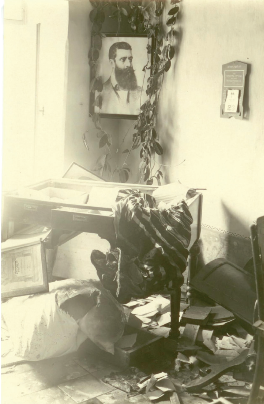
איור 4: חדר הרוס בבית אליעזר דן סלונים

כי ביום שישי ה-23 באוגוסט הלך יחד עם הרב פראנקו וחיים בגא'ו למשרד הדואר ומשם הם טלפנו לוועד הקהילה בירושלים. שניאורסון היה הדובר בטלפון והעונה בוועד הקהילה הזדהה כלוי. שניאורסון אמר כי יהודי חברון צפויים לשחיטה אם לא תשלח אליהם עזרה הם אבודים. בן שיחו ענה לו: "את מצב ערביי חברון יודעים אנו טוב מכם. הם מתנגדים למופתי ולא יעשו את רצונו". כאשר שניאורסון בא לאחר הפרעות למשרדי ועד הקהילה וחיפש את לוי איש לא ידע מי הוא. (שניאורסון תש"מ: 66-67; איור 4).