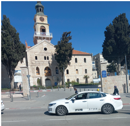
תמונה 8: מגדל הכנסייה במחנה שנלר, משה ארנוולד.

המחנה הצבאי שהיה במתחם בית היתומים שנלר עבר לרשות ההגנה לאחר שהבריטים עזבו את המקום באמצע מרץ 1948. המחנה הפך לבסיס מרכזי של כוחות ההגנה בירושלים. ממגדל הכנסייה ניתן היה לצפות על אזורים נרחבים בצפון ירושלים. לאחר שיצא כוח החילוץ לסייע לשיירה שנתקעה בשייח' ג'ראח בדרכה להר הצופים ב־13 באפריל (שיירת 'הדסה') צפו במהלך הקרב מגגות מחנה שנלר נדב ויסמן, קצין המודיעין של גדוד 'מוריה', וחיילים נוספים (גיחון 2008: 437). 28