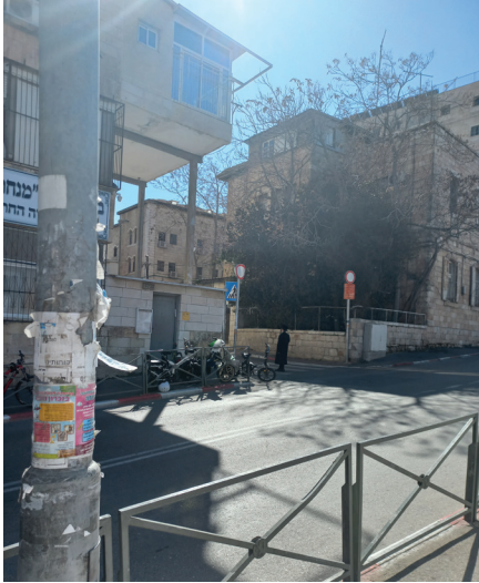
תמונה 6: בית דוד ילין/ פיקרד הצד הצפוני פברואר 2023, משה ארנוולד.