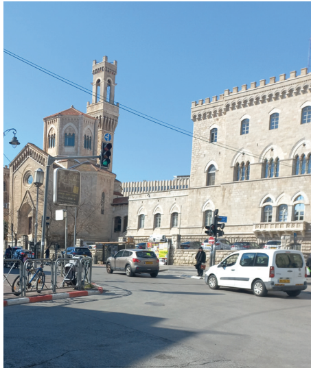
תמונה 7: מגדל בית החולים האיטלקי רחוב שבטי ישראל כיום משרד החינוך, משה ארנוולד.

בית החולים האיטלקי, הנמצא בקצה המזרחי של שכונת מאה שערים על גבול שכונת מוסררה, שימש את יחידת הר.א.פ. (Royal Air Force) – חיל האוויר המלכותי הבריטי.