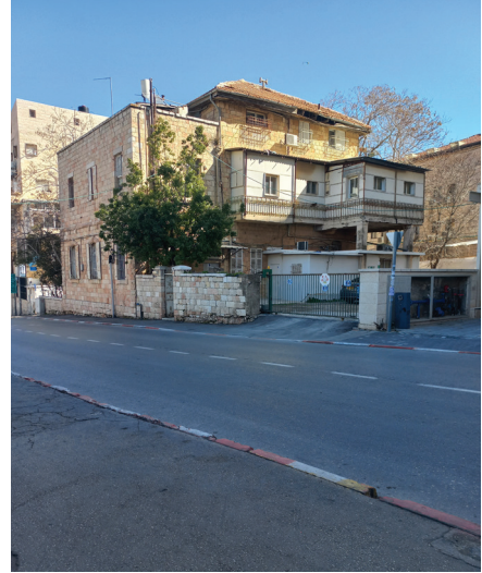
תמונה 5: בית דוד ילין, מבט מדרום, משה ארנוולד.