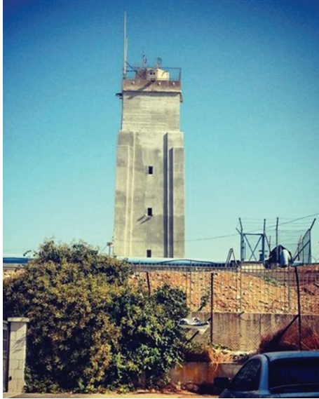
תמונה 2: מגדל המים ברוממה, משה ארנוולד.

למידע שהתקבל מתצפית זו הייתה חשיבות רבה לאחר ההתקפה על השיירה לעטרות ב־24 במרץ, שבה נהרגו 14 מנוסעיה ו־11 נפצעו. ההתקפה על השיירה נצפתה ממגדל המים ברוממה. 14 הקשר עם נווה יעקב ועטרות נעשה מעתה בכלי רכב צבאיים או משטרתיים, באמצעות בריטים ששיתפו פעולה עם הצד היהודי. כך למשל בלילה שלפני ליל הסדר קיבלו מגיני נווה יעקב הודעה בקשר לצאת בחצות לכביש שליד יישובם ולפרוק את האספקה שנשלחה אליהם במשוריינן משטרת, שצוותו הבריטי קיבל שוחד. תוך עשר דקות הם פרקו כ־30 חבילות מצות, יין, תחמושת ומכתבים, והמשוריינן חזר לירושלים בלי שהערבים ירגישו (לאובר תש״ט: 63–64). צבי טל (לימים שופט בבית המשפט העליון) וחייל נוסף בשם אלכס,