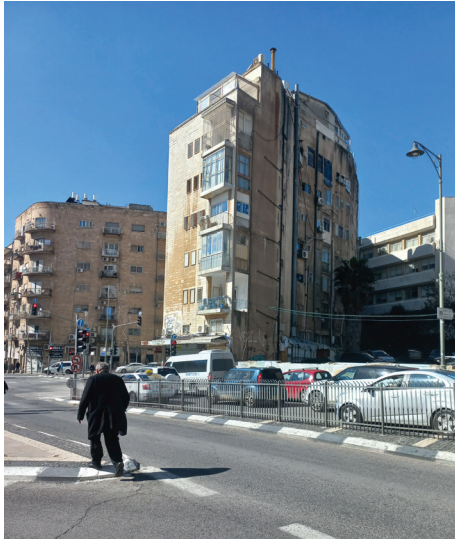
תמונה 4: בית פולצ'אק רחוב בן יהודה 36 [פינת רחוב עליאש] מבט מצפון-מזרח פברואר 2023, משה ארנוולד.

ג'אלה. לטלסקופים חוברו מצלמות שהפיקו תמונות תקריב של עמדות, עד לרמה של חרכי ירי וקנים המבצבצים מהם ותווי פנים של חיילי הלגיון הערבי. התצפיות מהמקומות הגבוהים אפשרו לאתר, באמצעות אזימוטים מצטלבים של הברק והרשף, את מיקום עמדות האויב (גיחון 2010: 255–256). 19