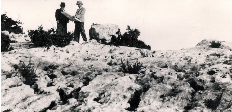
איור 8: על משטח סלע אופייני להר מתכנן הולצמן את כפר עציון

רושם שהתחזק בשיחה אישית שלו עם ויץ. 55 בשלהי 1934 הודיע הולצמן לוויץ מה הם השטחים שאל ההר מקיימת משא ומתן לרכישתם, ושהחברה תגביל את פעולתה רק לשטחים אלה. הוא הביע תקווה שהקק"ל תרכז את מאמצי הרכישה שלה מעבר להם. גם זה נראה כצעד בונה אמוץ. 56