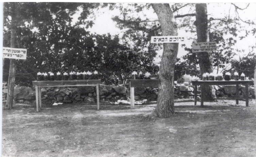
איור 5: שולחנות ערוכים בחצר המנזר הרוסי עבור משתפי ספורט העיתונאים

אחד מסימני הגאולה המובהקים, והאדמו"ר מסדיגורה, הרב מרדכי שלום יוסף פרידמן. 22 דוד בן גוריון נפגש עם הולצמן ב-10 באוגוסט 1934 ודן עימו במפעל החלוצי, אך אין בידינו מידע על הנאמר בפגישה זו. 23