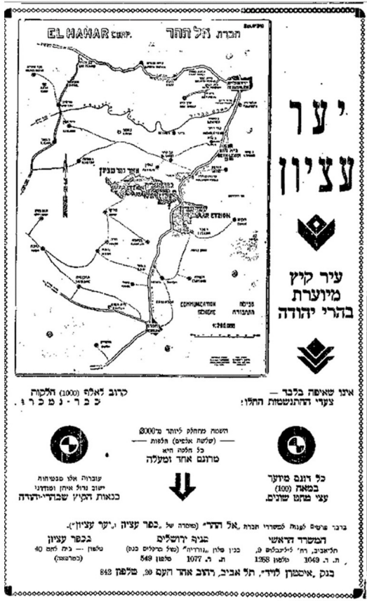
איור 4: מודעה בעיתון דאר היום (10 במרץ 1935)