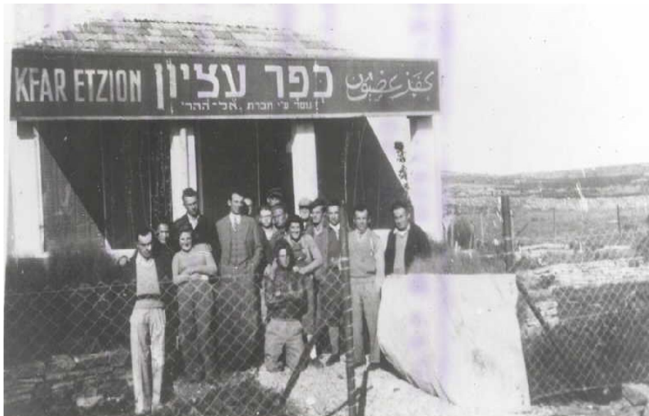
איור 7: המרפאה שהקים הולצמן בסמוך לבריכת המים וניצבת עד היום בצומת גוש עציון