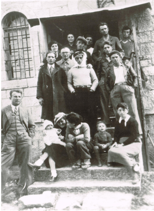
איור 9: מתיישבי אל החר – כפר עציון בפתח המנזר הרוסי לפני פרוץ המאורעות

ציון ברנובסקי לשבח וקיבל אות הצטיינות: "באומץ ובדבקות במשימה, למרות שנפצע בחמישה פצעים המשיך לירות על מתקיפיו ולהוביל את ההתקפה [על הפורעים]". 81 מושל בית לחם בא רכוב על סוס והציע להם שוב לעזוב את המקום, אך הם סירבו.