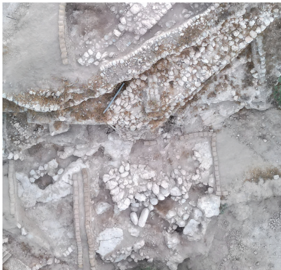
איור 4: מרכיבי הביצור מתקופת הברונזה התיכונה בשטח 3S – מבט־על. חומת הביצור או חלק ממגדל בחלקה העליון של התמונה, מסד מגדל שמירה מלבני בחלקה התחתון.

בניית המבנה ושימוש, וכן את יחסו למרכיבים האחרים בשטח, לאור הפגיעה בשרידים האדריכליים במסגרת סלילת כביש הגישה לכלי רכב.