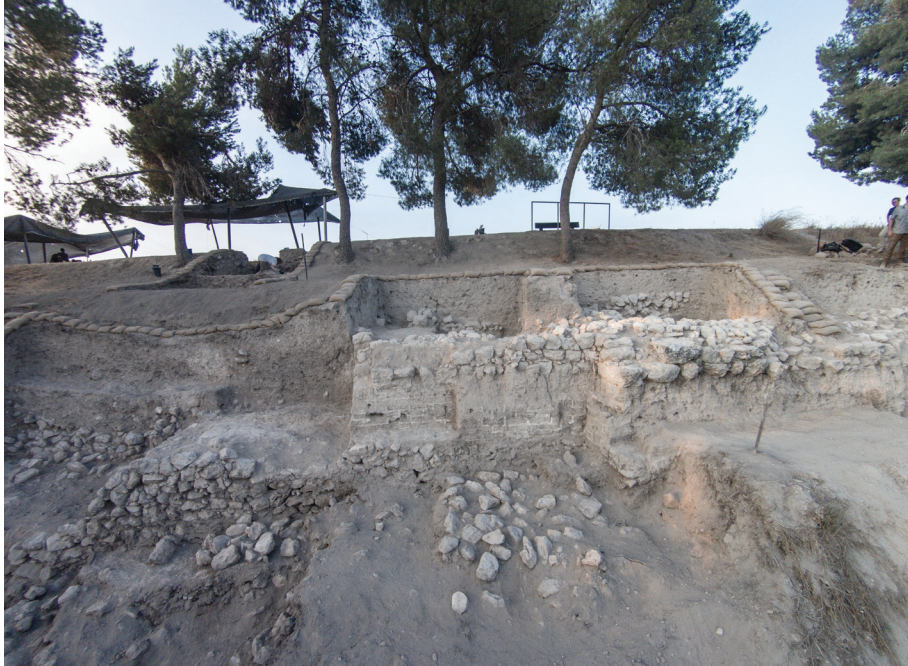
איור 3: חומת הביצור בשטח N1 שלה מסד אבן ומבנה על של לבני בוץ מטייחות, מבט דרומה (באדיבות משלחת לאוטנשלאגר לחפירות עזקה).

מרכיבי ביצור נוספים התגלו בשטח S3 (איור 4), הממוקם בסמוך לפינתו הדרום-מזרחית של התל. השטח נפתח בסמוך לגרמי המדרגות המודרניים, ועל גבי שביל גישה לרכבים, שהם חלק ממאמצי פיתוח האתר החל מאמצע המאה ה'לסה"נ. בשטח זה התגלה קיר רחב (2.20 מ' רוחב) שהתנשא לגובה של כמעט שלושה מטרים מהנדבך התחתון ועד לנדבך העליון שהשתמר. הקיר בנוי אבני שדה גדולות. כיוונו מצפון-מזרח לדרום-מערב ומיקומו בסמוך למדרונות התל עוקבים אחר המתאר הכללי של האתר. נראה כי בסמוך לכביש הגישה הקיר מגיע לסיומו. טרם התברר אם הקיר נקטע במסגרת פעולות סלילת הכביש, או שמא היה זה קצהו גם בעת העתיקה. ממדיו הגדולים ואופן בנייתו דומים לשני מרכיבי ביצור שנחשפו בשטחים האחרים: מסד החומה (וראו עוד למעלה) ומצודת המגדל (ראו עוד להלן). לפיכך, אנו מניחים כי גם בשטח זה נחשפו מרכיבי הביצורים מתקופת הברונזה התיכונה. עם זאת, ועד לחפירה נוספת של המבנה, לא נוכל לקבוע את אופיו, את שימושו ואת תאריך בנייתו המדויק.