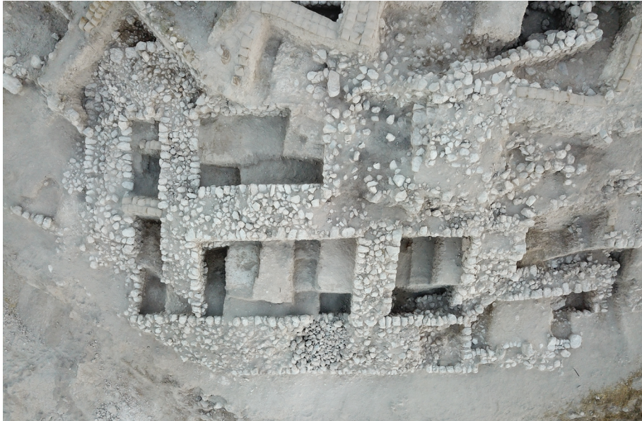
איור 5: יסודות מצודת המגדל בשטח E3 תחתון, מבט־על.

הברונזה התיכונה. בולדרים ועמודי תווך ענקיים תמכו בגג המבנה, ומפולת לבני בוץ כיסתה אותו. לאחר שמבנה זה נהרס הוא נקבר תחת מילויים מכוונים. על גביו הושתתה כיכר, ולצידה מבנה מחסנים. בנייה זו מבטאת את השלב הבנייה השני של תקופת הברונזה המאוחרת 3 (Webster et al. 2017).